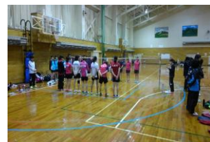
春季男子団体戦(札幌南高校にて H29.5.4)