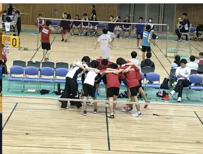
高体連札幌支部予選(野幌総合運動公園体育館・きたえーるにて H29.5.29~6.2)